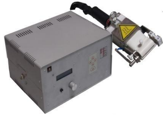
Module de contrôle