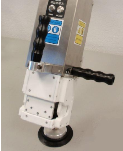
Fixation sur panneau horizontal