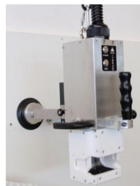
Fixation sur panneau vertical