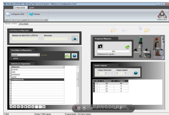
Logiciel de programmation